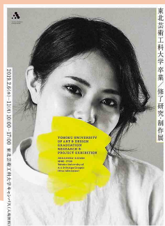
東北芸術工科大学卒業/修了研究制作展

学びの集大成 約500点の力作が学内に展示され、 大学キャンパスが壮大なミュージアムへ変貌します。 毎年3万人近くが訪れる一大イベントです。